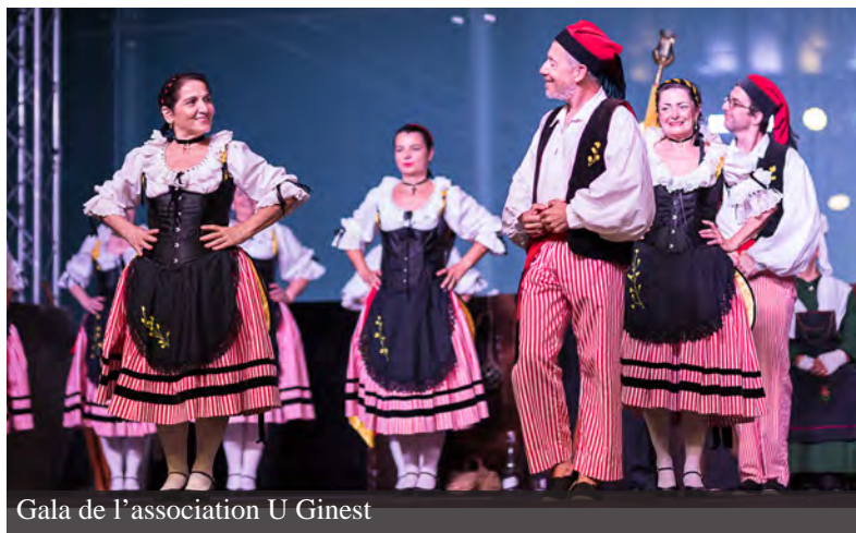
Gala de l'association U Ginest