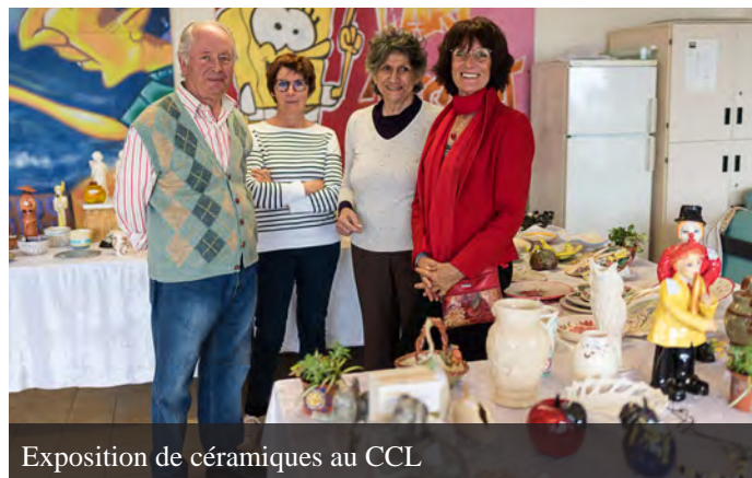
Exposition de céramiques au CCL