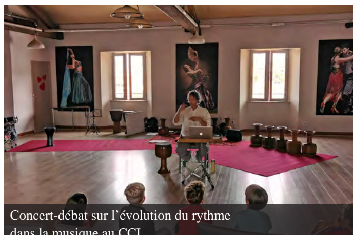
Concert-débat sur l'évolution du rythme dans la musique au CCL