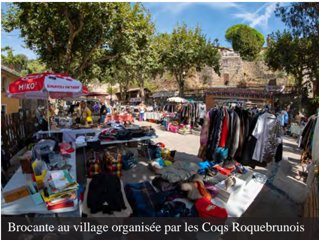
Brocante au village organisée par les Coqs Roquebrunois