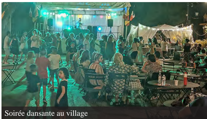
Soirée dansante au village