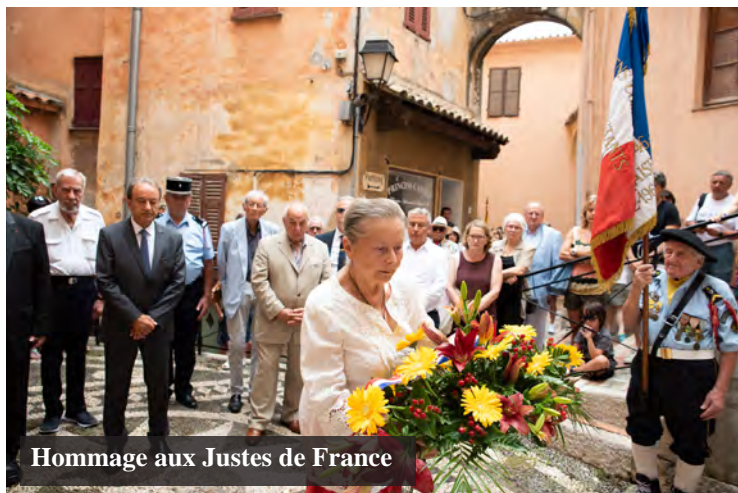
Hommage aux Justes de France