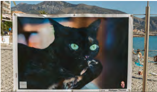
Exposition Photomenton sur l'esplanade Joséphine-Baker et sur l'avenue Paul-Doumer