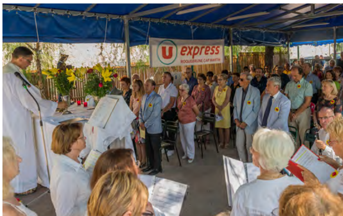
Fête patronale de la Saint-Louis