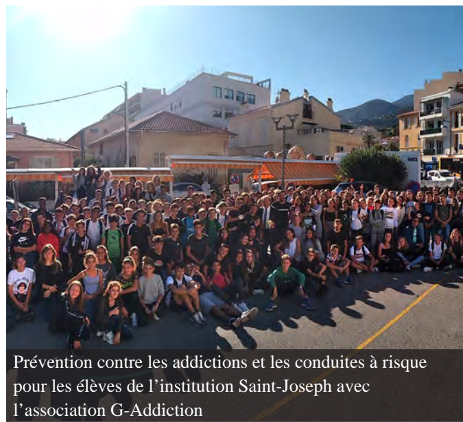
Prévention contre les addictions et les conduites à risque pour les élèves de l'institution Saint-Joseph avec l'association G-Addiction