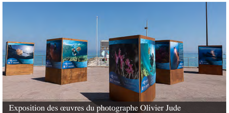
Exposition des œuvres du photographe Olivier Jude