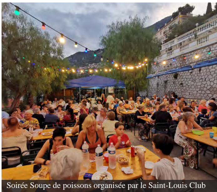
Soirée Soupe de poissons organisée par le Saint-Louis Club