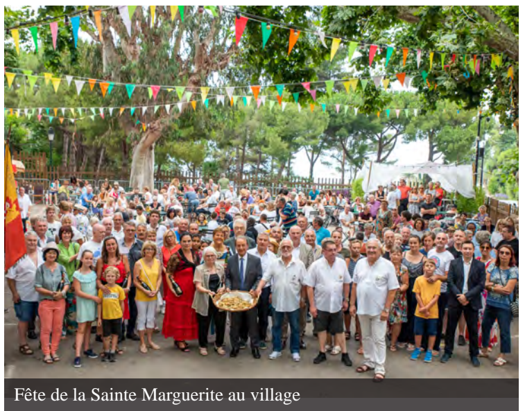
Fête de la Sainte Marguerite au village