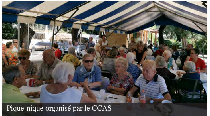
Pique-nique organisé par le CCAS