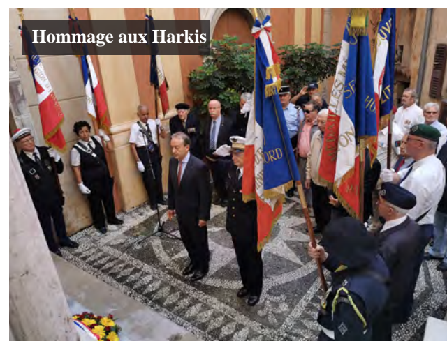
Hommage aux Harkis

Au village de Roquebrune-Cap-Martin, au pied du monument aux Morts, ont eu lieu, après la célébration du 14 juillet, des dépôts de gerbes le 21 juillet dans le cadre de la journée nationale à la mémoire des victimes de crimes racistes et antisémites de l'État français, puis l'hommage aux Harkis et aux formations supplétives le 25 septembre.