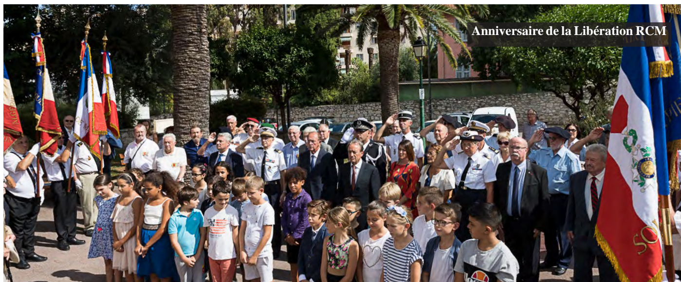
Anniversaire de la Libération RCM

En outre, a été célébré le 6 septembre, le 75 e anniversaire de la libération notamment au square du 8-mai, en présence des élèves de l'école de la plage et de certains des anciens combattants qui ont participé à la libération de Roquebrune-Cap-Martin le 6 septembre 1944.