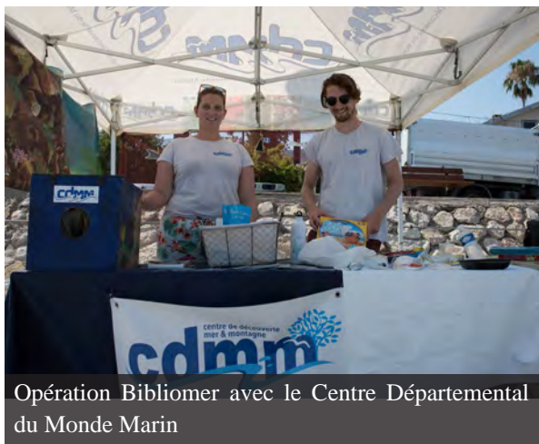
Opération Bibliomer avec le Centre Départemental du Monde Marin