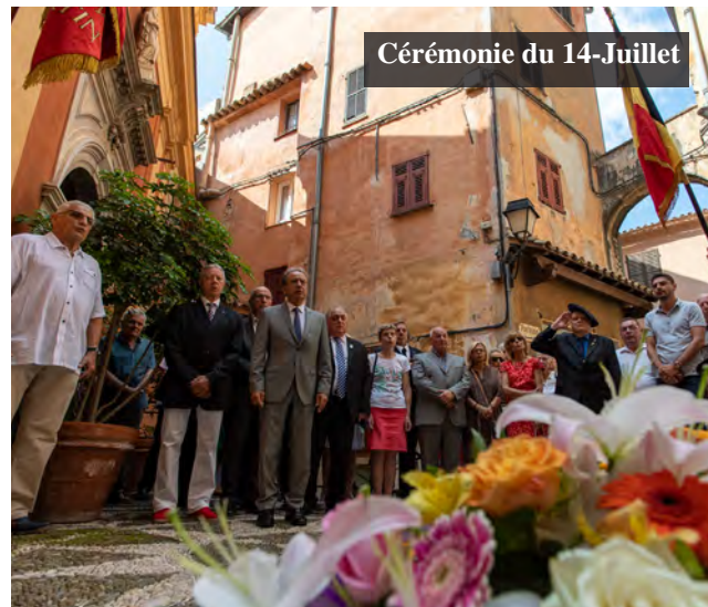
Cérémonie du 14-Juillet

Le calendrier commémoratif a été dense le trimestre précédent. Les habitants de Roquebrune-Cap-Martin ont ainsi honoré ses différentes manifestations. La participation des enfants, associés à ces rendez-vous avec la population et les associations patriotiques, est utile pour que le devoir de mémoire perdure.