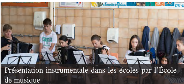
Présentation instrumentale dans les écoles par l'École de musique