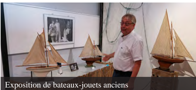
Exposition de bateaux-jouets anciens